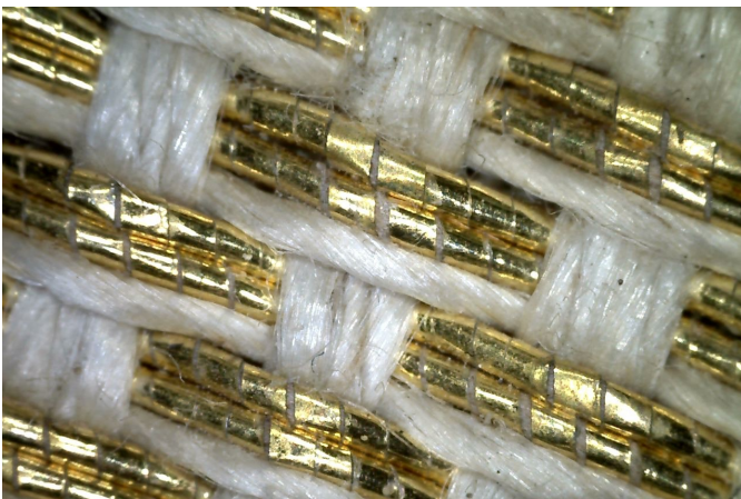
Mikroskopbillede af ægte guldtråde i Beckers antependium.

buer op mod topfeltet med opstandelsen. Et stærkt symbol. – Det er også tydeligt, hvordan altertavlens farver i olivengrønne, teglrøde, lyse og nederst blå nuancer genskabes i garnerne i antependiet og hvordan guldet på altertavlens udskæringer, ramme og søjlernes stafferinger gentages med ægte guldtråde.