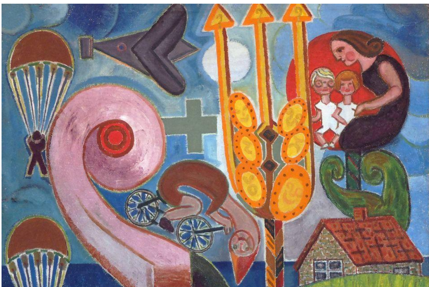
“Krig og fred” af Henry Heerup