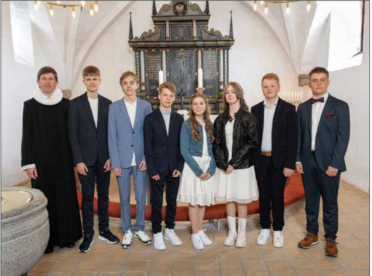
Konfirmanderne i Tømmerby-Lild 2023.