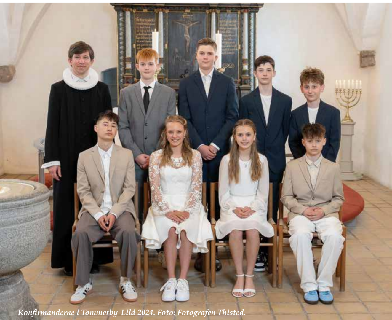
Konfirmanderne i Tømmerby-Lild 2024.