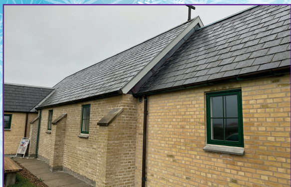
Lildstrand Kirke med nye vinduer og mursten efter renovering.