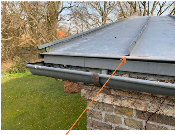
Forkert udført afslutning ved tagfod, har gjort at der er direkte adgang fra tagfoden og ind til undertaget.