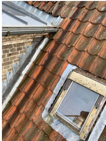
Besigtigelse af frontispicens tag, viser tydelige tegn på tagarbejde som ikke er udført håndværksmæssigt korrekt.