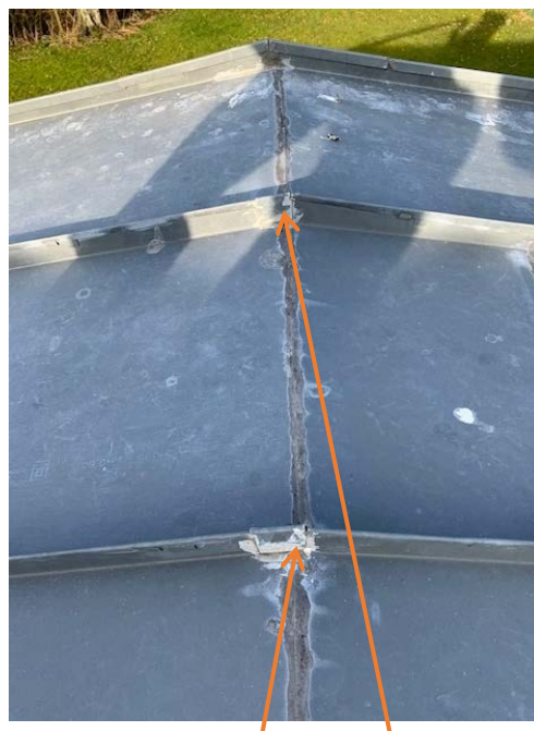
Kip samlinger er forkert udført, og er skjult af med zinkplade, hvorefter den er loddet. Dette er ikke udført håndværksmæssigt korrekt.