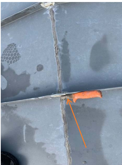
Forkert udført zink arbejde, resultere i af der opstår revner i loddede samlinger som vidst på billedet.