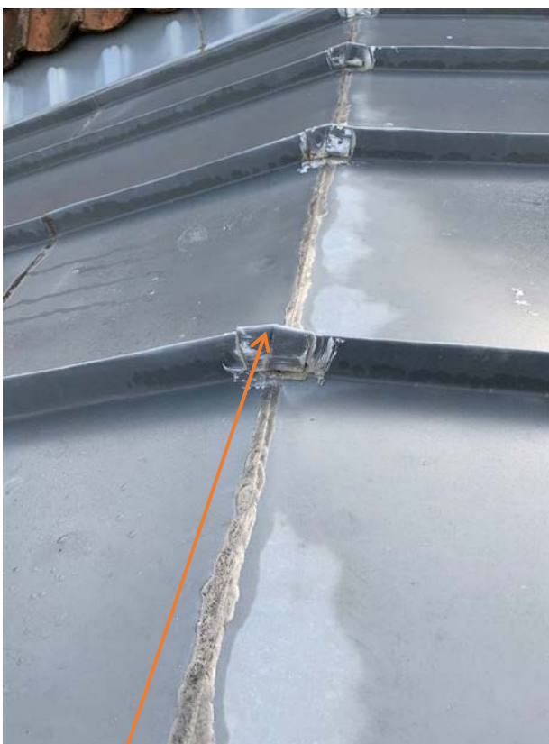
Manglende fals og skjult samling som er loddet har fået zinken til at revne i samlinger.