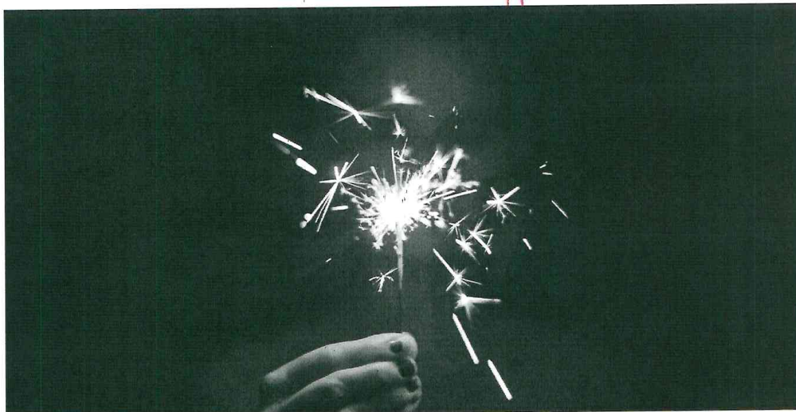
Nytårskollekten samler i 2019 ind til forfulgte kristne.