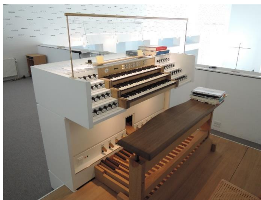
Dybker kirke (Silkeborg)