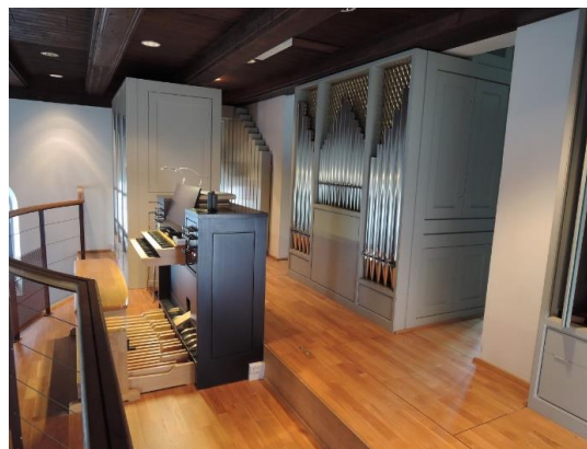
Bangsbostrand kirke (Frederikshavn)