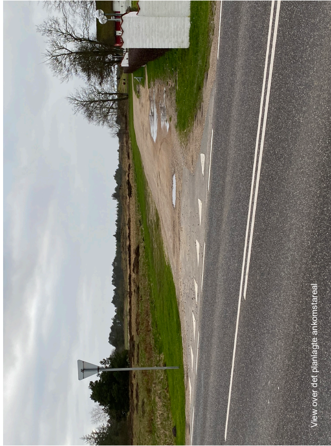
View over det planlagte ankomstareal

Formålet er at sikre, at alle mennesker kan færdes her også uden for den lyse sommer. Det gælder øens faste beboere og de mange besøgende (80.000 pr år) ved Sct. Clemens i almindelighed, men det er også en væsentlig del af projektet, at der bliver tale om handicapvenlig parkeringsmulighed, og at Sct Clemens hermed vil kunne leve op til normale standarder på dette område.