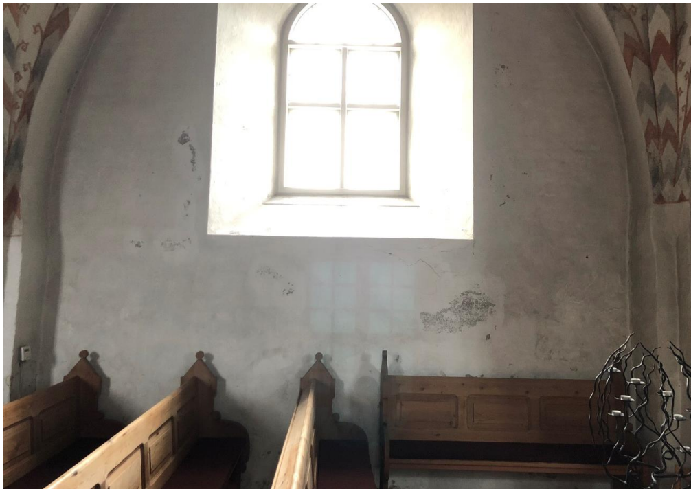
Afskalning på nordre væg i skibet, bemærk også tilsodning, særligt i højre side.