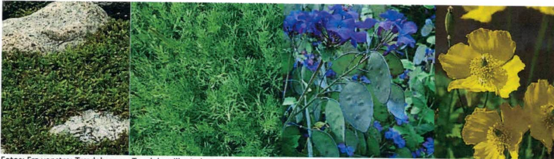
Fotos: Fra venstre: Trædebregne, Trædekamille, Judaspenge og Valmuesøster.