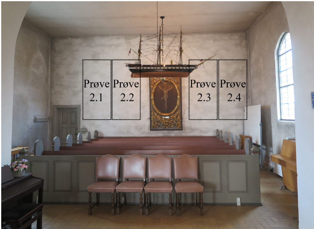
Figur 3. Nordre korsarm, nordvæggen. Placering af kalkningsprøve 2.1, 2.2, 2.3 og 2.4.