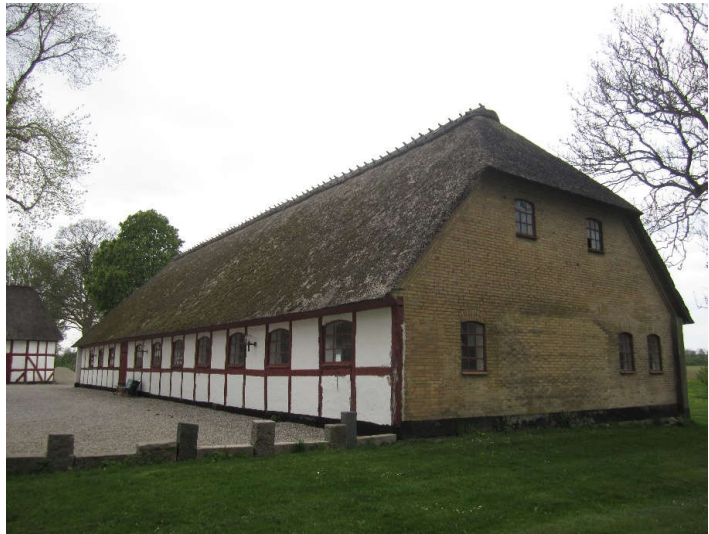
Staldbygningens set fra sydøst.