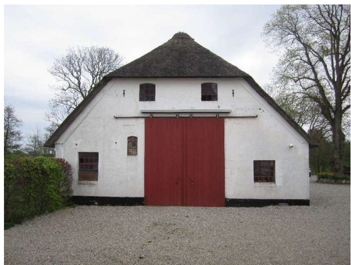
Staldbygningen set fra vest.