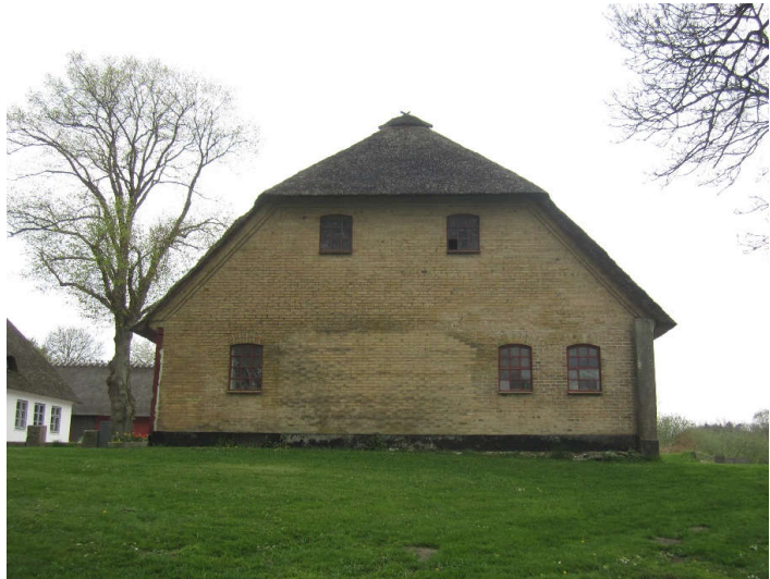
Staldbygningen set fra øst.