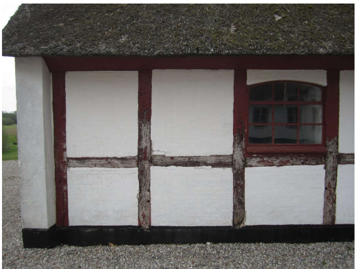
Fag 1-3 fra vest. De malede overflader på bindings- værkstømmeret er nedvasket på fac- dens nederste halvdel.