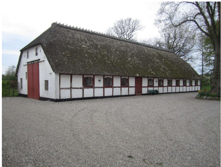
Staldbygningen set fra sydvest.