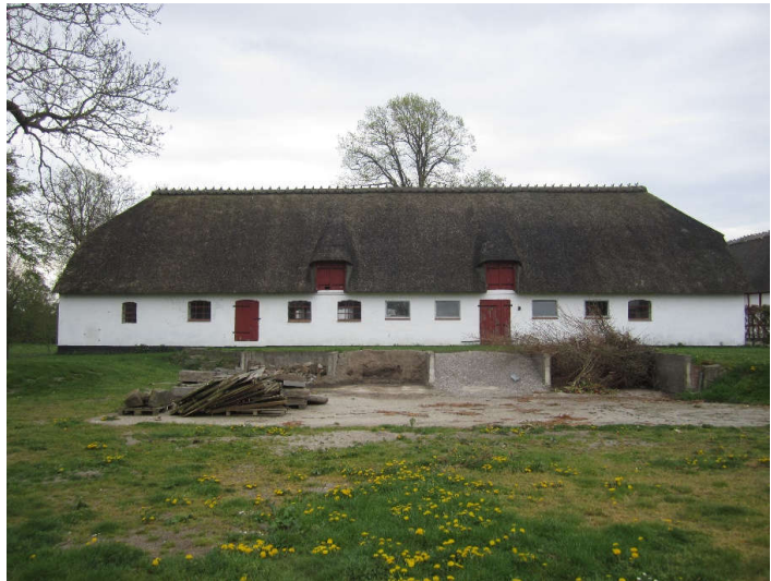
Staldbygningen set fra nord.