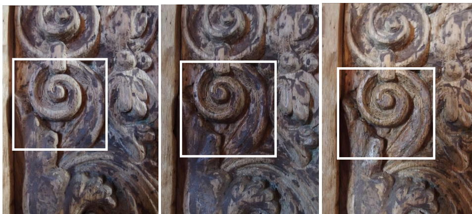
Detaljefotos fra testens udførelse i relieffet. Foto tv.: Før behandling, foto midt: Efter oliebehandling; foto th.: Efter oliebehandling og indfarvning af brunlig kitmasse.