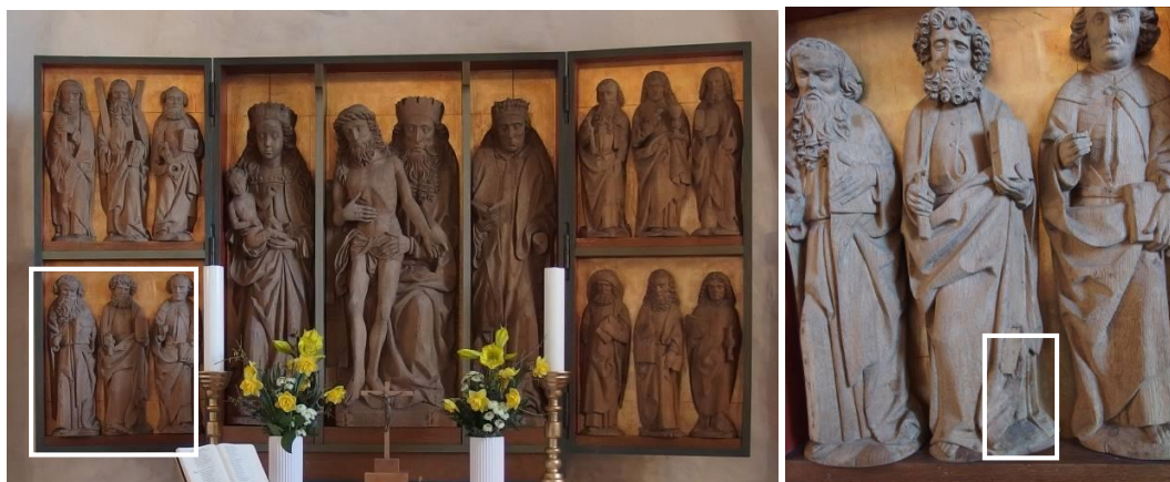
Altartavle og figur før testen blev udført. Firkanten angiver henholdsvis det felt, testfiguren er placeret i (foto tv.) samt område på figuren hvor testen blev udført (foto th.)

træbehandling. Denne type olie er valgt da den trænger godt ind i træet, og derfor ikke skal fortyndes med terpentin. Derudover giver den ikke en nær så stærk glans som f.eks. standolie eller linoliefernis (hvor fortynding med terpentin er nødvendigt ved første påføring). Overskydende linolie blev tørret af efter godt en halv time. Kittet område fremstod efter behandlingen meget lyst, og blev indfarvet med Gamblin Conservation Colours (en ureaaldehyd) på en bund af gouache efter olien var tør (efter godt 2 uger). Før retouchering blev området isoleret med Paraloid B72 (3% i acetone/ ethanol 1:1).