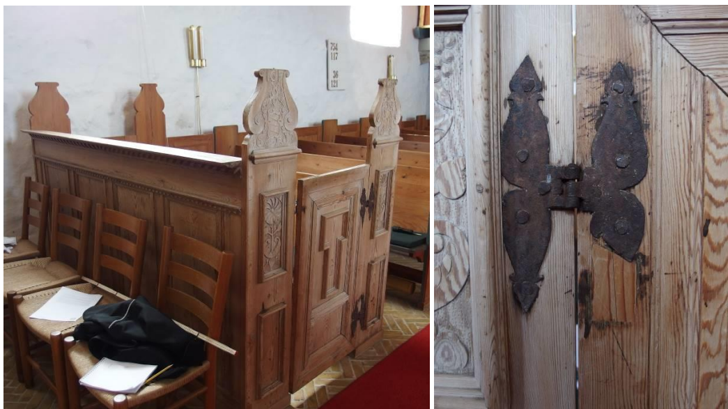
Herskabstole fra ca. 1653 i afrenset fyrretræ. Foto th.: Mørke, uoprettelige rustpletter (?) misfarver træet langs beslag

Stolene er sandsynligvis påført en blegende behandling eller hvidpigmentering som led i behandlingen fra 1955, som beskrevet i kirkekonsulenternes rapport. Denne formodning blev yderligere forstærket under arbejdet med tests i kirken (se nedenfor). En rensning af træets overflade forud for en oliebehandling, førte til en let mørkning. Desuden ses hvidligt materiale, som ikke ligner grunderingsrester, i revner og ujævnheder i træet.