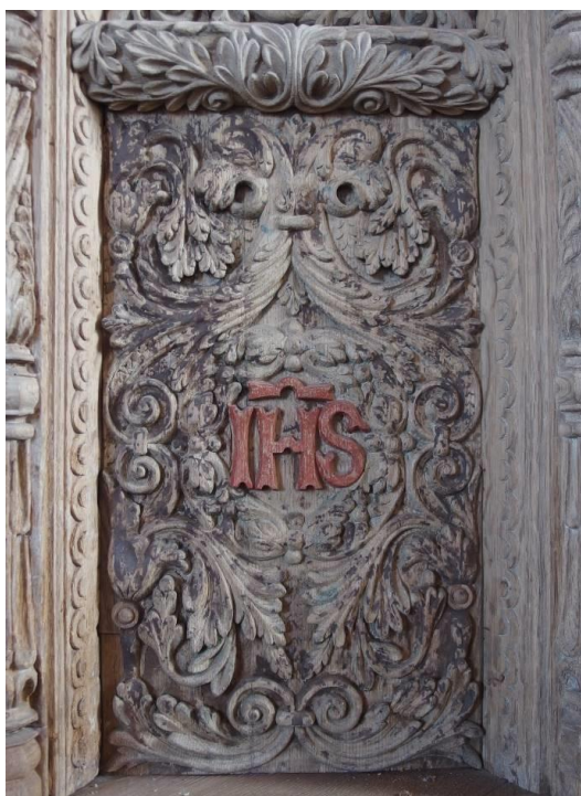
Prædikestol fra ca. 1575. Foto th.: Udskæringsarbejdet er skæmmet af en opfyldningsmasse med en afvigende, mørkebrun farve.