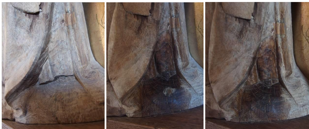
Detaljefotos af testområde før oliebehandling (foto tv.), efter oliebehandling (én omgang) (foto midt) samt efter oliebehandling og retouchering (foto th.).