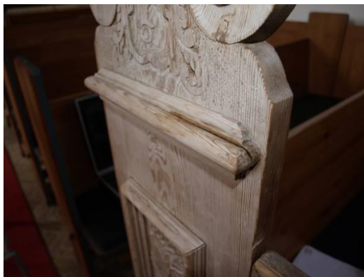
Brud i nordlige bagerste gavl

Forskellig brug har sat forskellige spor, hvilket har medført en vis variation i træets farve, og har givet træet en naturlig patina. Et brud i den nordlige bagerste gavl mod kirkerum er sjustket limet.