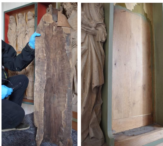
Foto tv.: Bagside af altertavlefigur. Træet er mørkt og der ses spor efter borebiller. Foto th.: Under altetavlefigurerne ligger et tykt lag smuds.

Bagklædningens forgyldning har enkelte ridser.