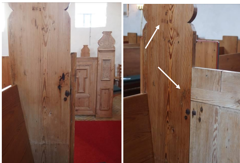
Foto tv. Før behandling. Foto th. Efter oliebehandling i én omgang og indfarvning af mørke misfarvninger (nederste pil) og enkelte, udkittede områder (øverste pil).

Det anbefales derfor at indfarvning af misfarvede områder kun udføres ved beslag, da indfarvning udover dette ikke står til måls med resultatet og tidsforbruget.