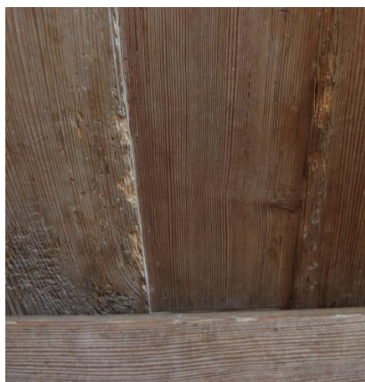
Frønnet og nedbrudt træ ved fodliste på sydlige herskabsstol