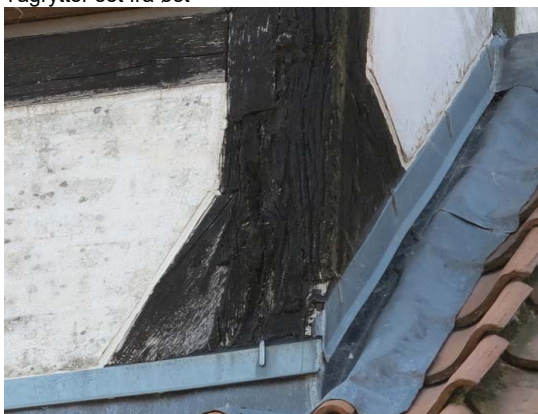
Hjørnestolpe mod nordøst