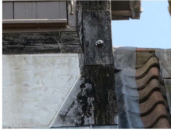
Hjørnestolpe mod sydvest