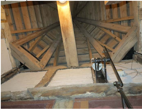
Tagkonstruktion over klokke er tæt