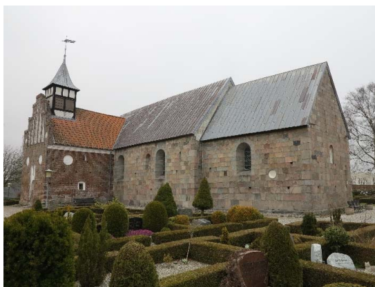
Lime kirke set fra sydøst