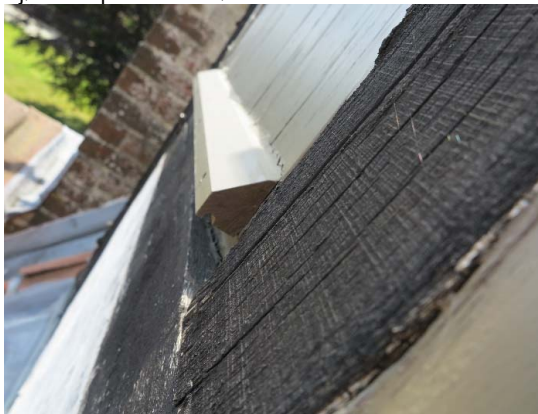
Vandnæse ved luge