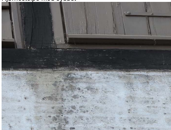
Fugt fra stolpe ned over mur – gummifuge slipper.