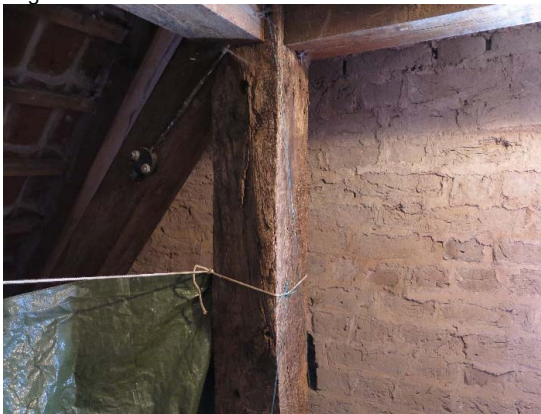
Presenning ophængt i tagrum