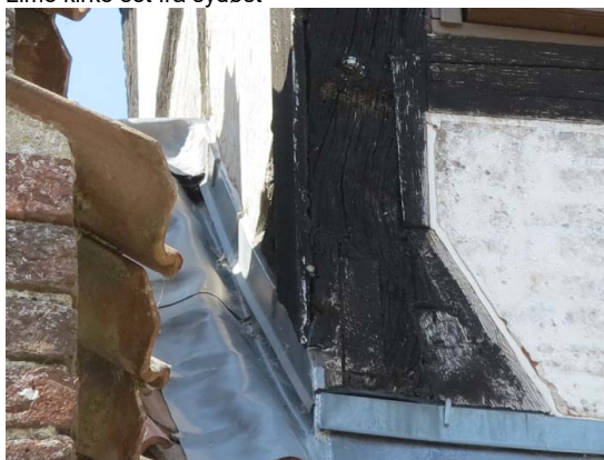
Hjørnestolpe mod sydøst