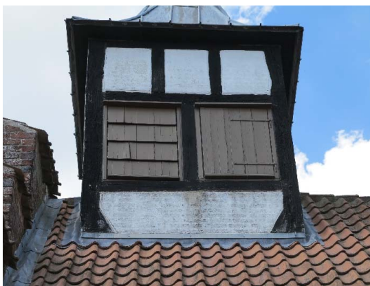
Tagrytter set fra øst