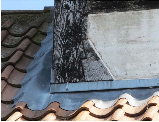
Hjørnestolpe mod nordvest