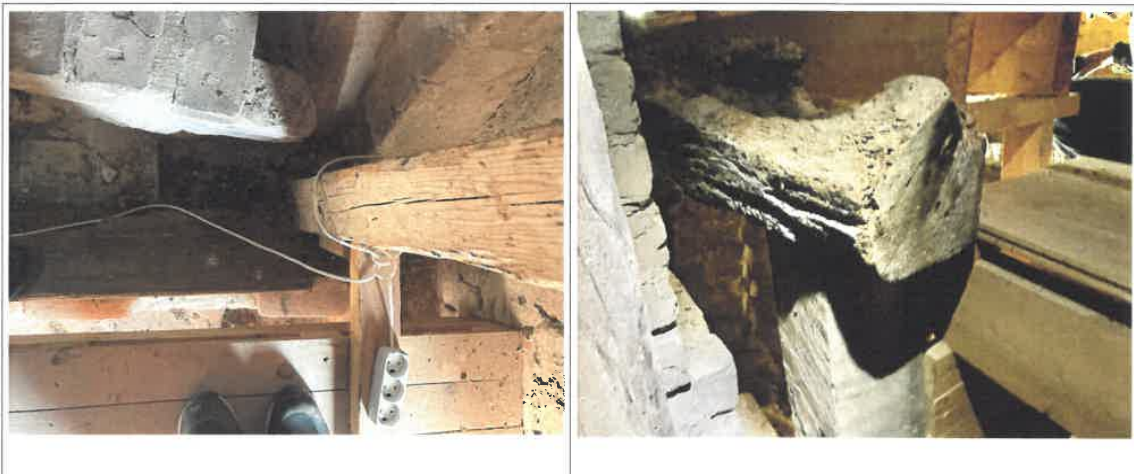
Stol der står ned på rådskadet rem.

Det er vor tanke at skifte tømmeret, med tilsvarende træ, hvor det er konstruktivt forsvarligt, og forstærke hvor udskiftning ikke er mulig. Adgang via et gavlvindue til højre for tårnet. Det er endvidere planlagt at reimprægnere aktive angreb af borebiller.