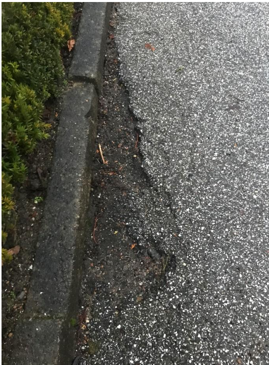
Et af flere huller langs kantsten.