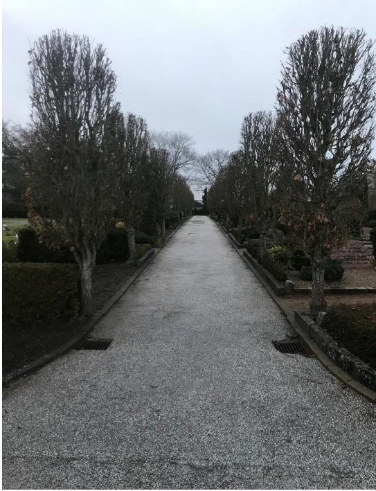
Øverste del af asfaltstien