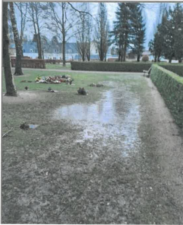
Figur 5: Hjørnet af afdeling FPL hvor enkelte gravsten ligger helt under vand.