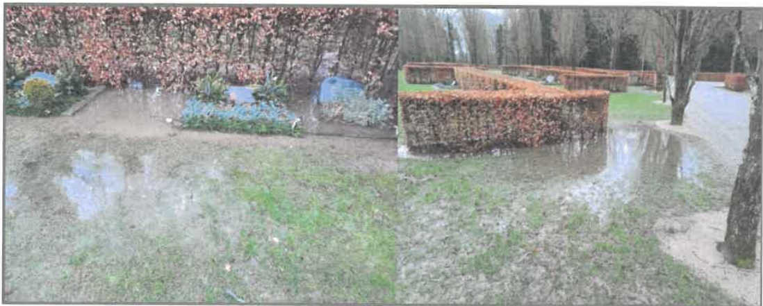
Figur 4: Stående vand på afdeling G.