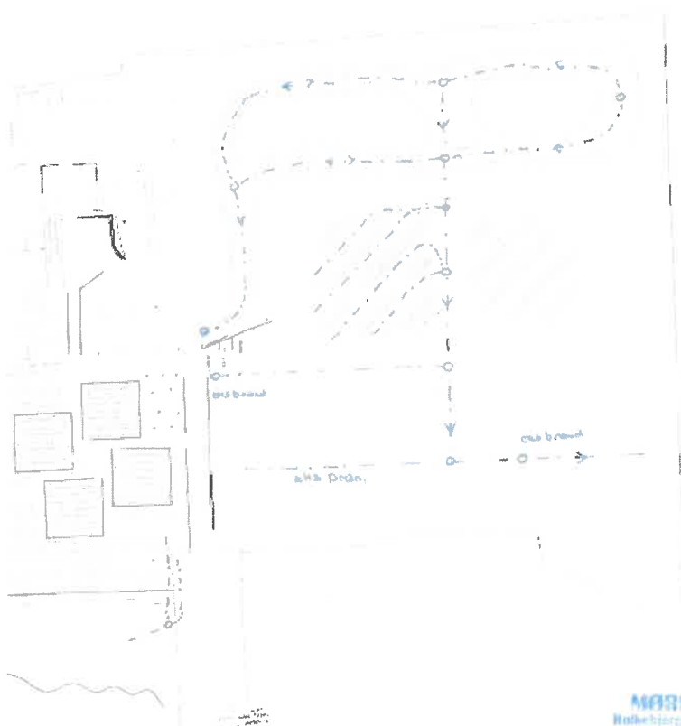
Figur 2: Kort over det nye dræns planlagte forløb

Mørk og Skov Aps har udarbejdet et prisoverslag over, hvad det vil koste at anlægge nyt dræn på afdeling SKG, samt afdeling G og i hjørnet af afdeling FPL. Hele overslaget er vedhæfte som bilag.