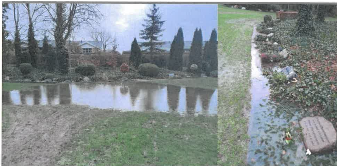
Figur 1: Til Vestre gangareal på afdeling SKG til højre gravsteder på SKG

Samtidig fremstår arealerne i perioder usikne, da plænerne bliver forvandlet til mudder-marker. Hvilket vi også har mange henvendelser fra pårørende om, da de er kede af udseendet, og i nogen tilfælde ikke kan nå frem til deres gravsted. I forbindelse med gravkastninger er det problematisk for følget og præsten at skulle bære kisten gennem mudder og vand. Det er tilmed også nødvendigt at pumpe vand fra graven helt op til nedsænkningen af kisten.