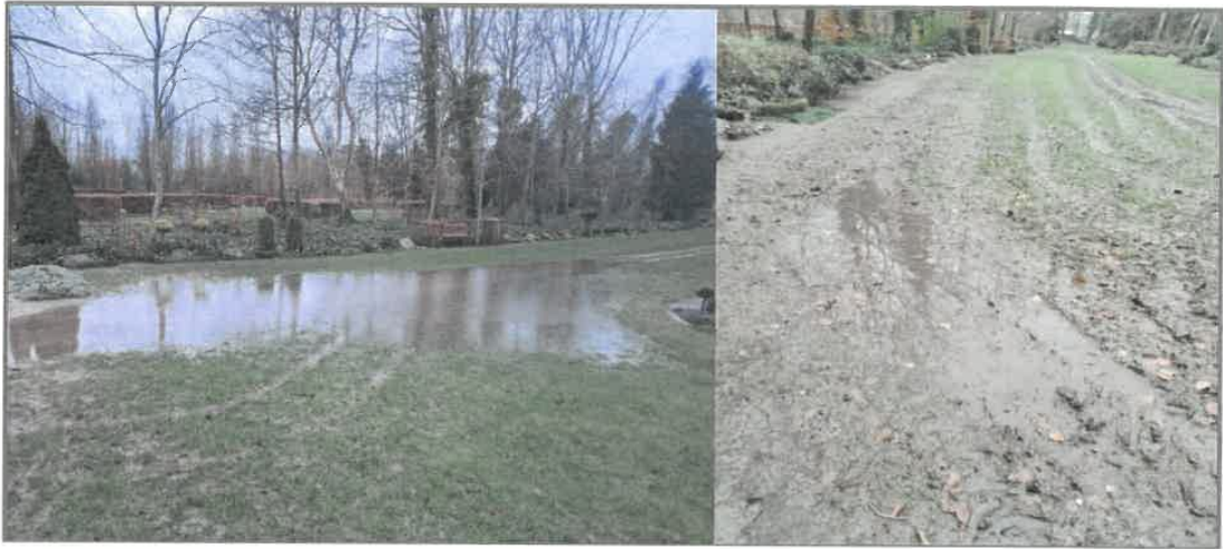
Figur 3: Plænen på afdeling SKG.