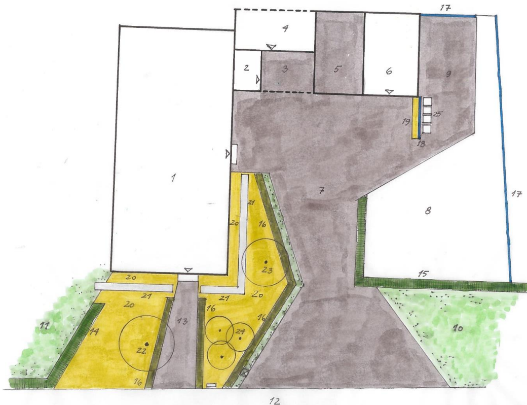
Præstebolig Ved Kirken 3, Vindinge – Skitse, ændring af ankomstareal, 10.04.2022. Nord er til højre.

I teksten herunder er skitsens indhold forklaret nærmere. Numre i tekst henviser til numre på skitsen.