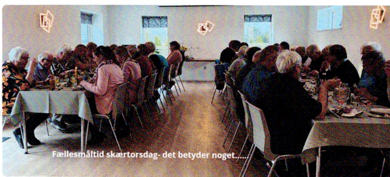
Fællesmåltid skærtorsdag- det betyder noget.....

denne hyggelige tradition afholdes i Købelev-Vindeby til næste år