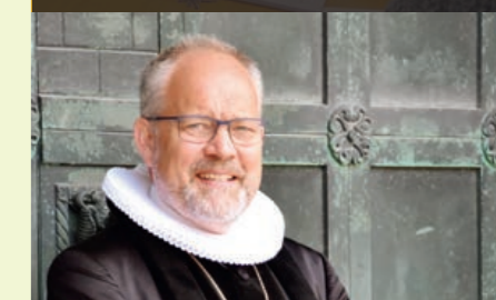
Elof Westergaard, Biskop over Ribe stift holder gudstjenesten i Lunde kirke den 29. september 2024 kl. 14.30.