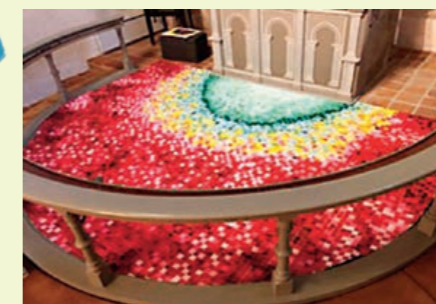
Illustration af kortæppet. Forud for det første af ca. 600.000 sting i november 2021, er gået nogle år fra beslutningen blev taget i menighedsrådet til kunstneren fremlagde sin tegning. Den 29. september 2024 fremvises det endelige resultat.

Så er kortæppet syet færdig af sypigerne i Lunde. Det har været i 2½ år. Tæppet er syet i fem baner. Disse baner er sendt til Selskabet for Kirkelig Kunst i København for at blive syet sammen til et tæppe.