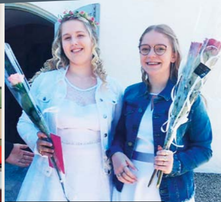
HENNE d. 30. maj