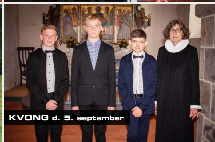
KVONG d. 5. september