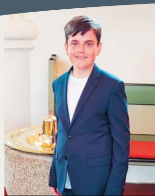
LØNNE d. 2. maj