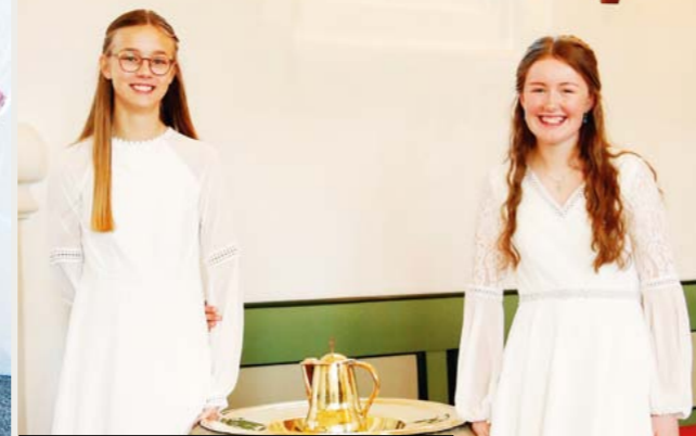
LØNNE d. 5. september