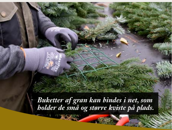
Buketter af gran kan bindes i net, som holder de små og større kviste på plads.