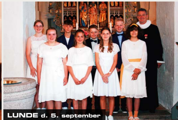
LUNDE d. 5. september