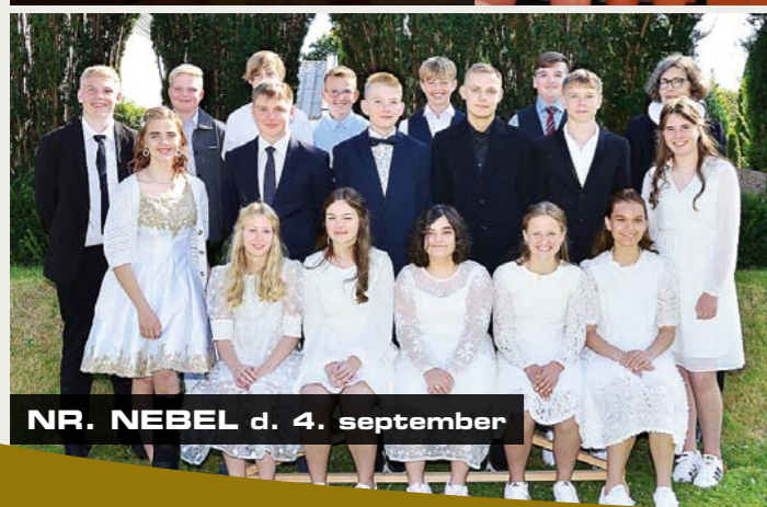
NR. NEBEL d. 4. september