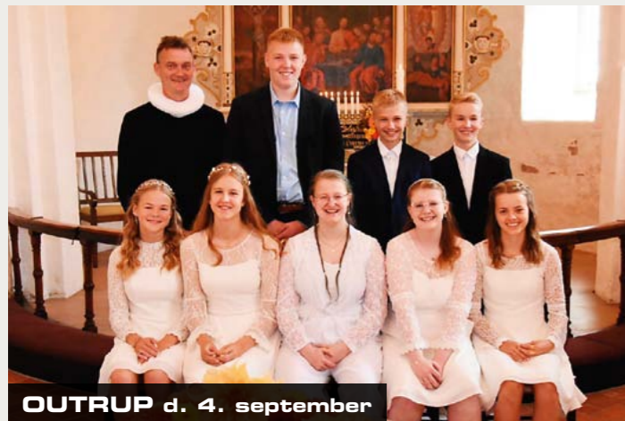
OUTRUP d. 4. september