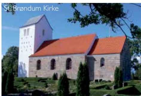
St. Brøndum Kirke