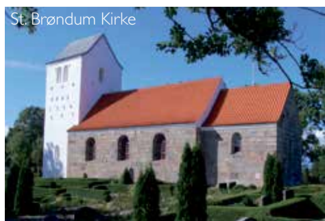
St. Brøndum Kirke