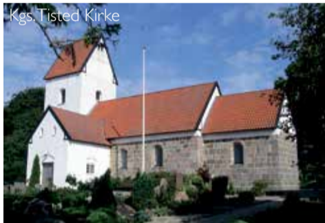
Kgs. Tisted Kirke