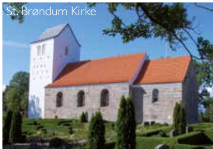
St. Brøndum Kirke