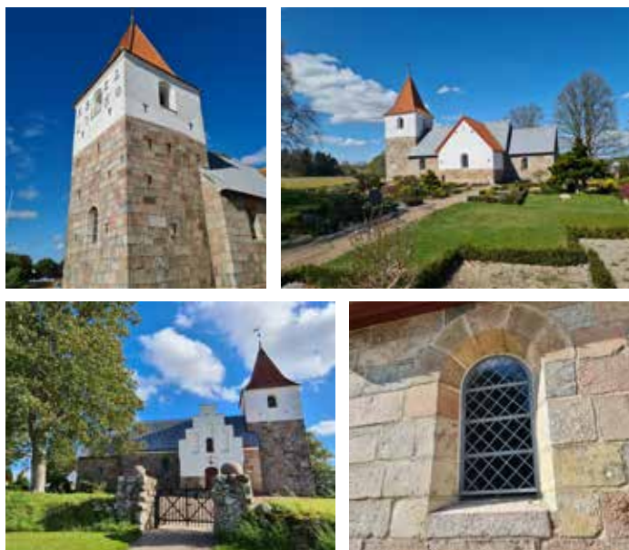
Billedtekst: Skørping Kirke i Gl. Skørping.