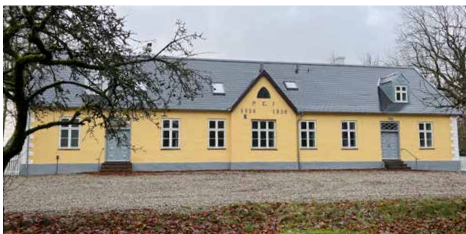
Den færdigrenoverede præstegård i St. Brøndum.

Præstesituationen er fortsat uafklaret. Der har været foretaget 2 opslag, hvor der ikke kom ansøgninger til 100 % stillingen med udgangspunkt i Lyngby-Terndrup, og kun 1 ansøgning til den delte stilling med udgangspunkt i St. Brøndum-Siem-Torup. Biskoppen har bestemt nyt opslag af begge stillinger. Men vi er vist desværre ikke alene om den situation – der mangler præster overalt i landet.