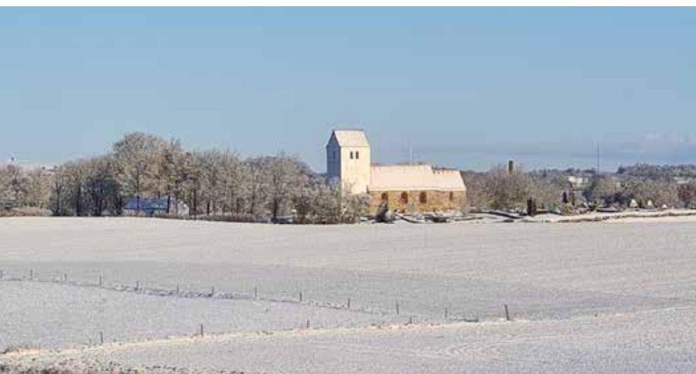
St. Brøndum Kirke midt i det sneklædte landskab.