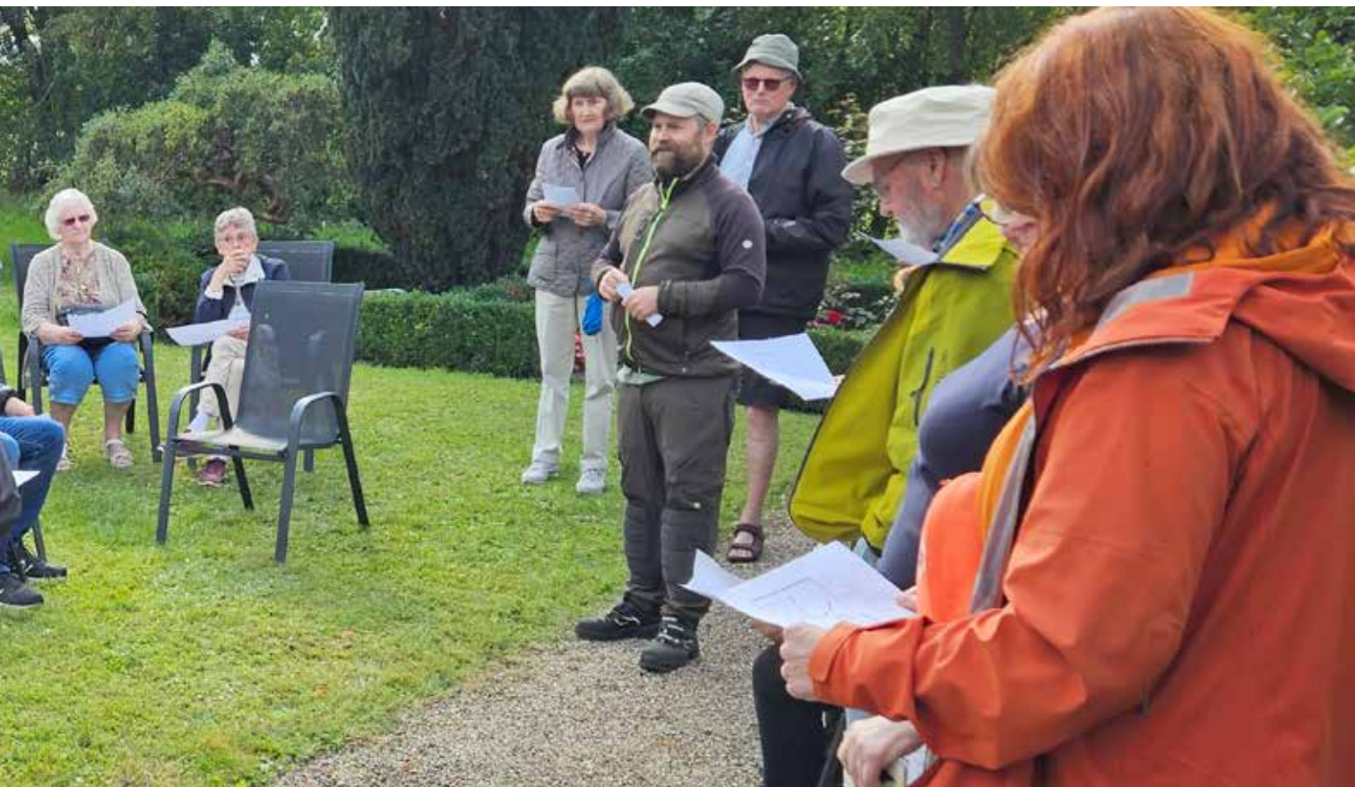
En god eftermiddag på annekskirkegården

mindre gravsteder til nedsættelse af urner. Tomme gravsteder forekommer især på annekskirkegården.