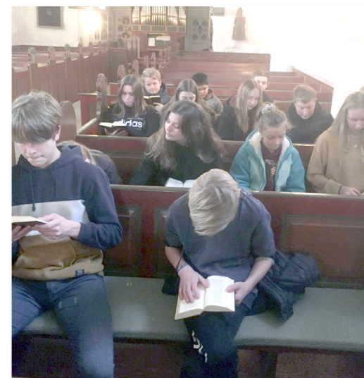
Konfirmanderne leder efter dagens salme i Salmebogen.

Endelig er der en fælles ekskursion for de to hold i slutningen af marts. April handler om påske og forberedelse til konfirmationsdagen.