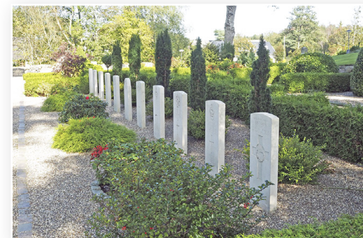
De 11 flyversten på Aarestrup Kirkegård.

Det betød alverden dengang, at besættelsesmagten var blevet besejret. Vi lever stadig under den frihed, der derefter fulgte. Derfor sætter vi hvert år lys i vinduerne 4. maj og mindes den aften, som vore slægtninge oplevede så stærkt, at de måtte synge og takke Gud.