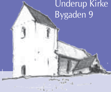
Underup Kirke Bygaden 9