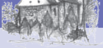
Nim Kirke Præstevænget 2