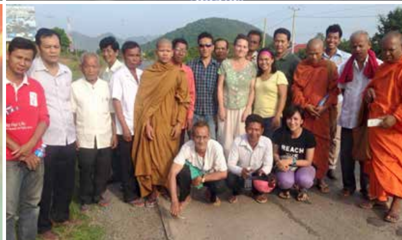
Foto fra en workshop med buddhister, muslimer og kristne i Cambodja.