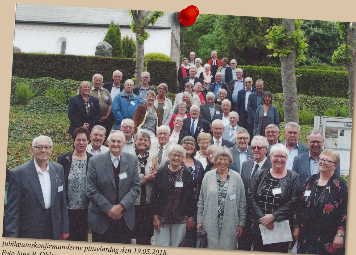
Jubilæumskonfirmanderne pinselørdag den 19.05.2018.