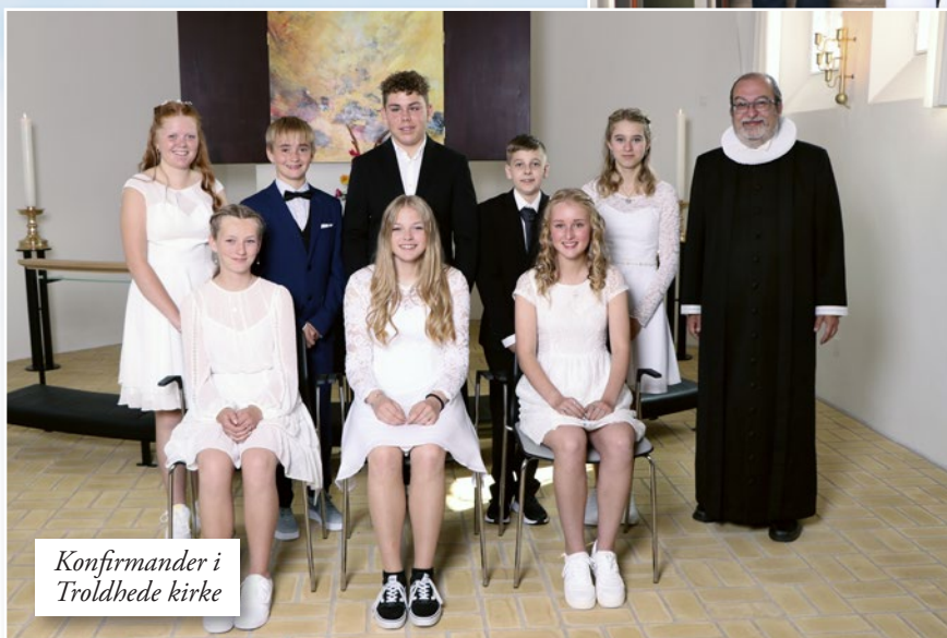
Konfirmander i Trolldhede kirke