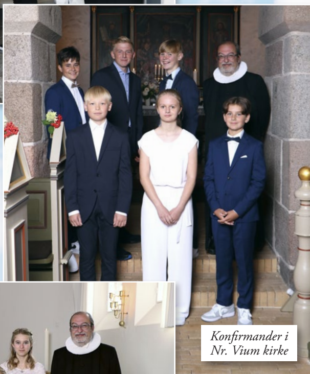
Konfirmander i Nr. Vium kirke