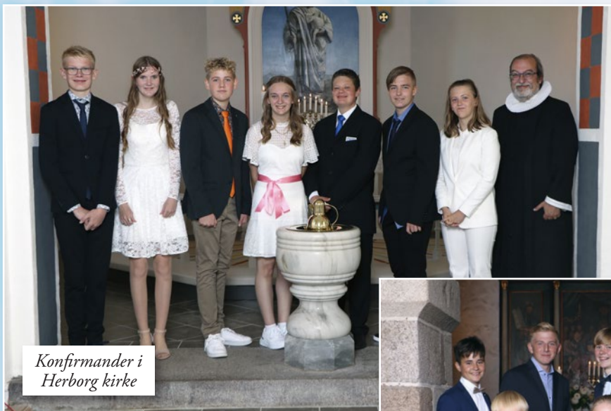
Konfirmander i Herborg kirke