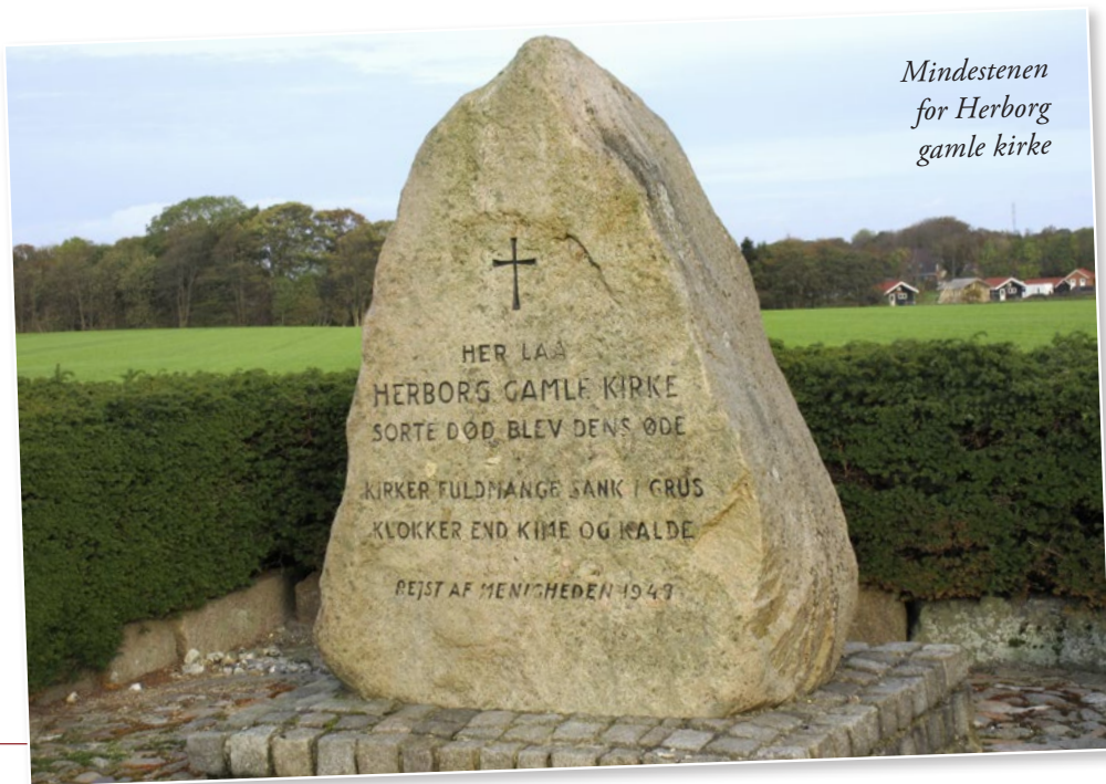
Mindestenen for Herborg gamle kirke