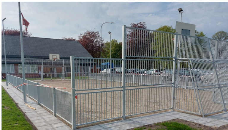
Den flotte Nye multi- bane

I skrivende stund er man ved at lægge sit hånd på det storstilede projekt med etablering af et aktivitetsunivers i anlægget ved Gedstedhallen, og når du læser dette, har der været indvielse og aktiviteterne står til fri affbenyttelse for os alle sammen.