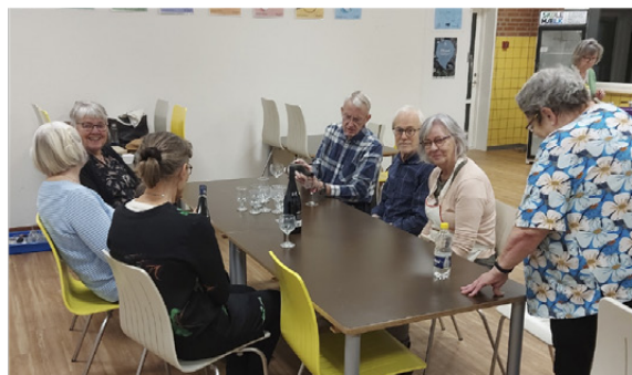
Køkkenpersonalet har en lille pause i madlavningen

Vennepunktet har igen gang i en forrygende sæson. Folk strømmer til, og stemningen er helt i top. Men successen kommer jo ikke helt af sig selv, den er et resultat af en masse frivilliges indsats både før under og efter arrangementerne