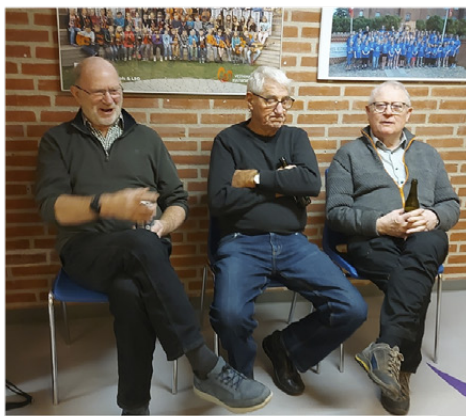
Så er alle borde og stole stillet op

Under arrangementet er der også en gruppe, der løber rundt og gør det hele klar med mad, kaffe, projektor, spil til sange osv, og efter arrangementet er der en mindre hær, der går i gang med at rydde op i salen og i køkkenet, så skolen kan starte næste morgen, uden at man kan se, at Vennepunktet har været der.