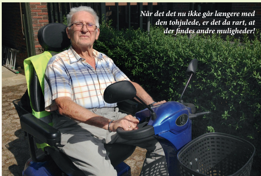
Når det nu ikke går længere med den tohjulede, er det da rart, at der findes andre muligheder!