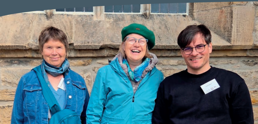
Tre af sommerens feriepræster i bøjt bumør