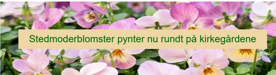
Stedmoderblomster pynter nu rundt på kirkegårdene