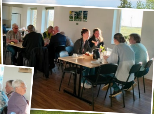
Lille Bedeaften i FASTER