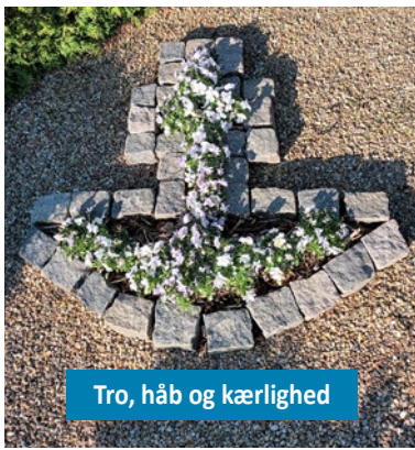
Tro, håb og kærlighed