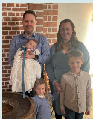
Vitus, døbt den 28. januar i Skjold Kirke

Besøg din kirke på facebook: www.facebook.com/raarupkirke