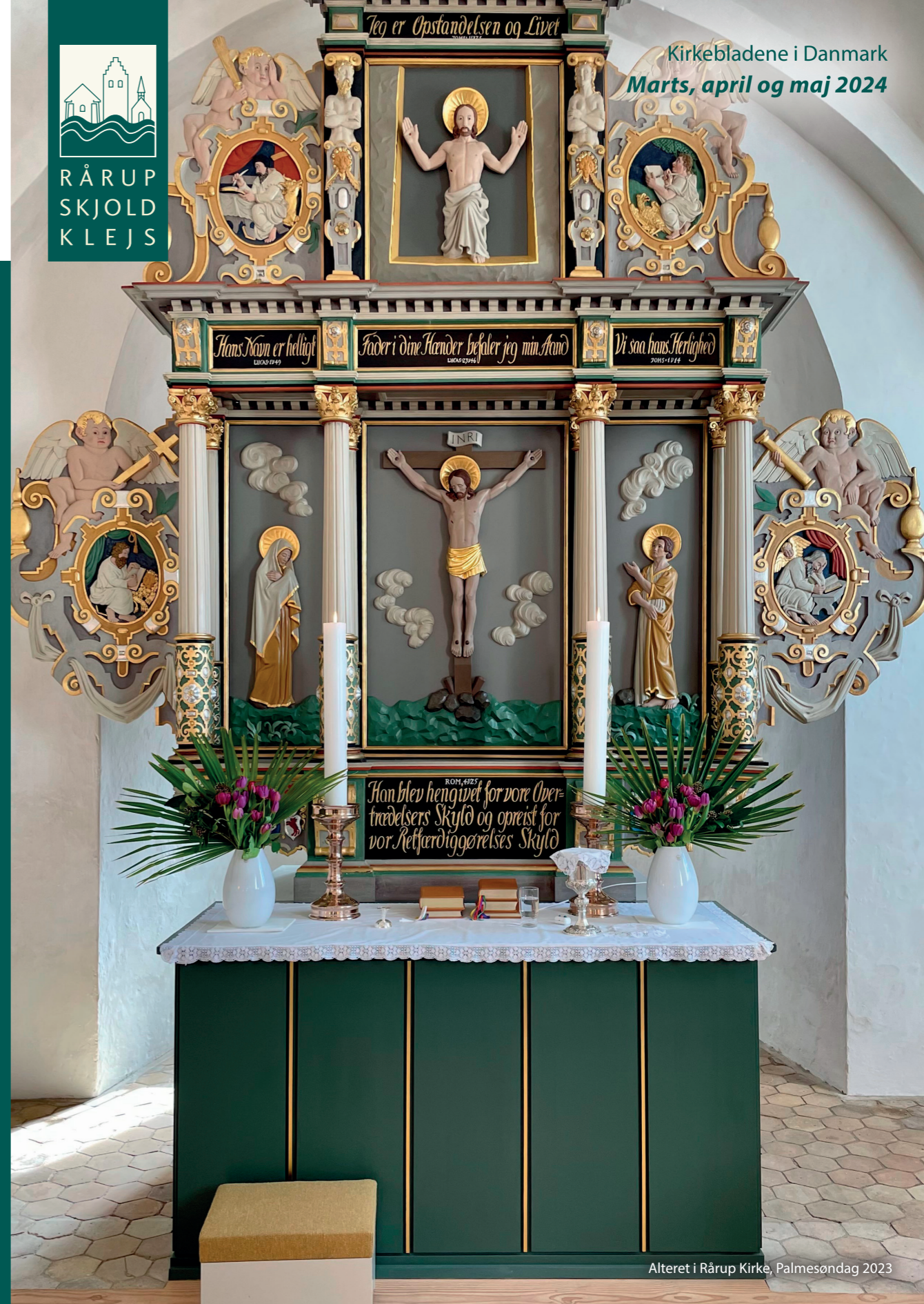
Alteret i Rårup Kirke, Palmesøndag 2023

Kirkebladene i Danmark Marts, april og maj 2024