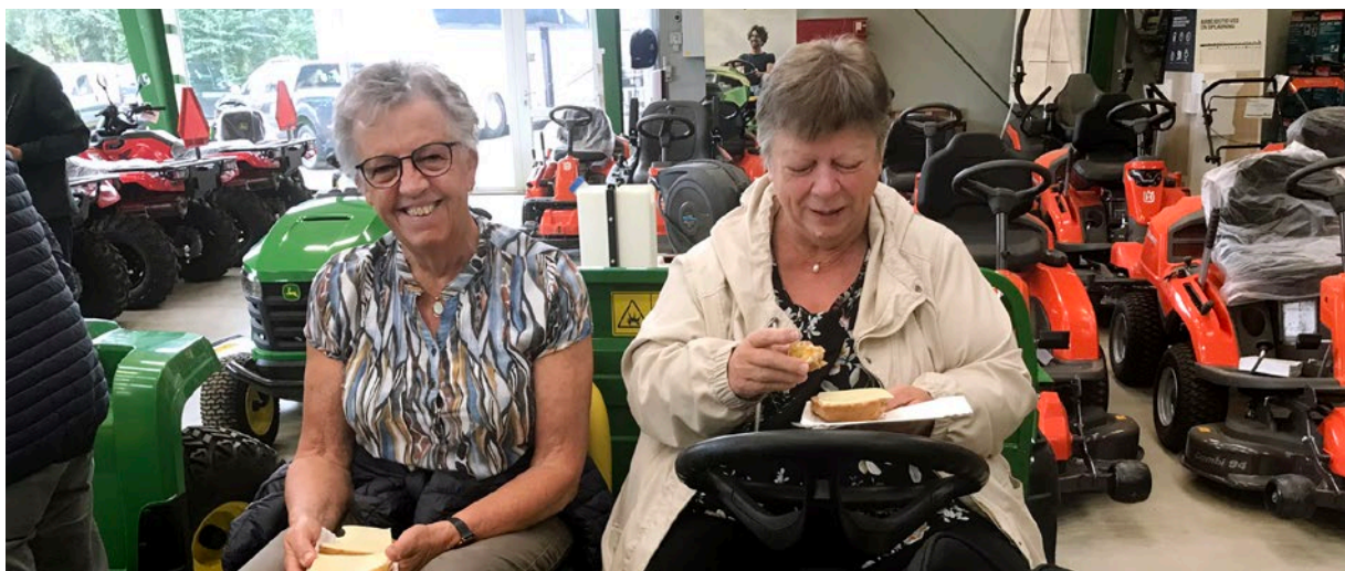
Formiddagshygge på årets sogneudflugt