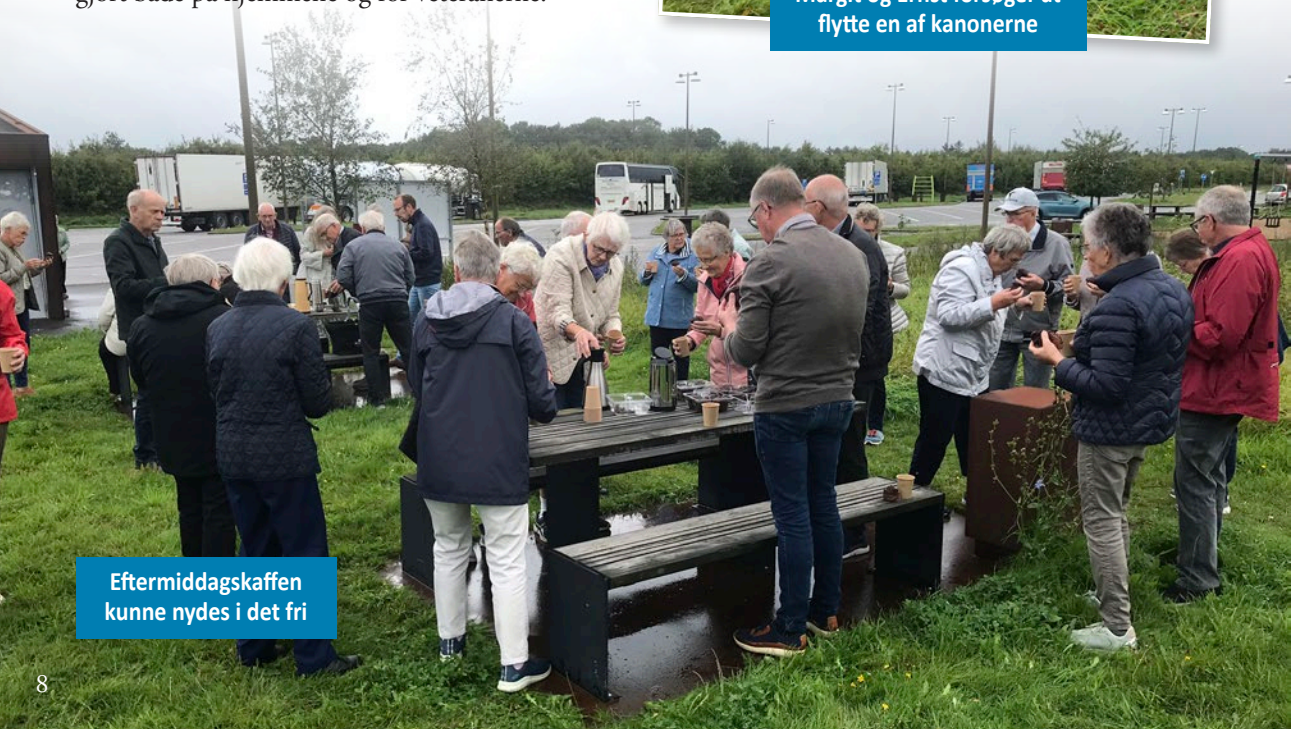
Eftermiddagskaffen kunne nydes i det fri