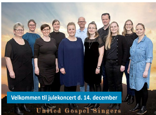
Velkommen til julekoncert d. 14. december