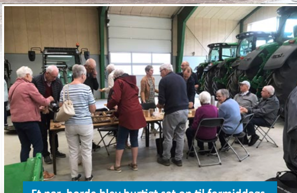
Et par borde blev hurtigt sat op til formiddagskaffe blandt landbrugsmaskinerne i Farre