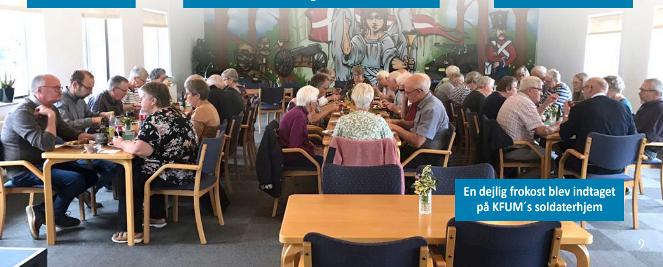
En dejlig frokost blev indtaget på KFUM's soldaterhjem