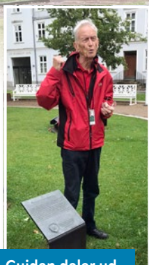
Guiden deler ud af sin store viden