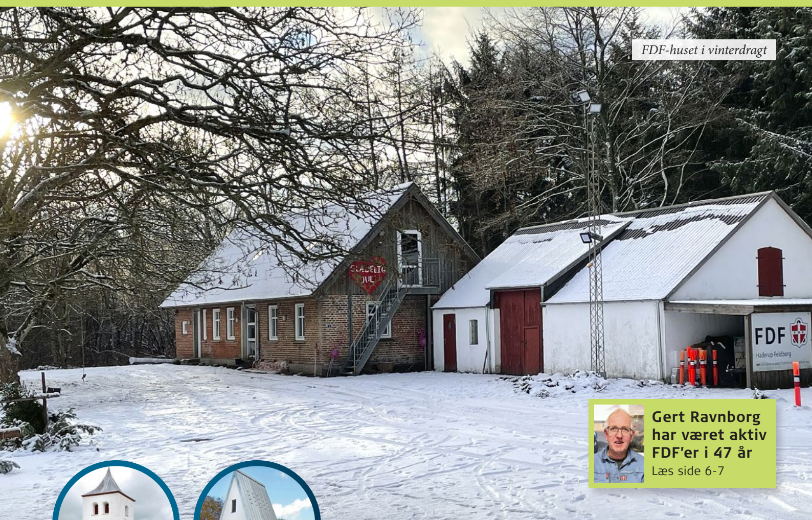
FDF-huset i vinterdragt