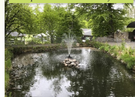
Den oprensede dam midt i maj 2022.