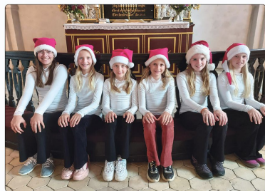
Glud Kirkes Børnekor