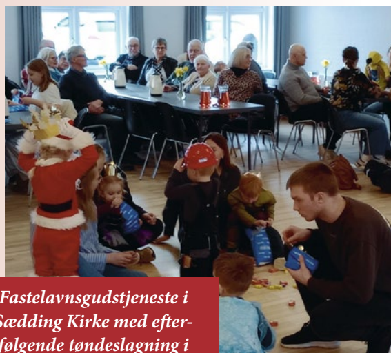
Fastelavnsgudstjeneste i Sædding Kirke med efterfølgende tøndeslagning i Sædding Forsamlingshus.