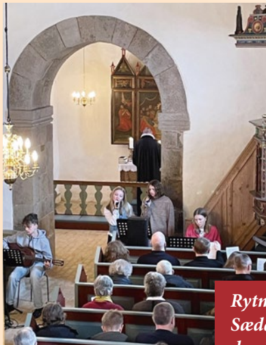
Rytmisk gudstjeneste i Sædding Kirke søndag den 1. marts med Sædding Efterskole.