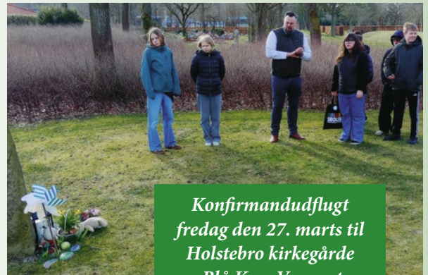
Konfirmandudflugt fredag den 27. marts til Holstebro kirkegårde og Blå Kors Varmestue i Herning.