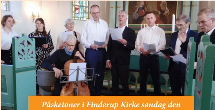
Påsketoner i Finderup Kirke søndag den 22. marts med cellist, lejlighedskor og solist.