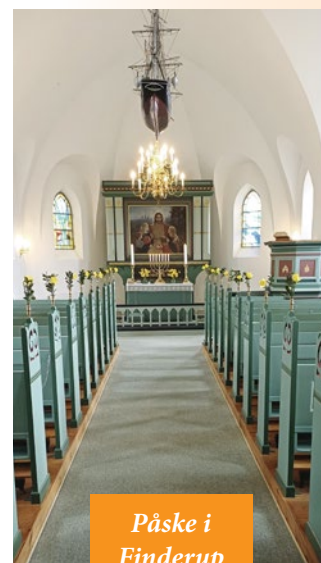
Påske i Finderup Kirke.