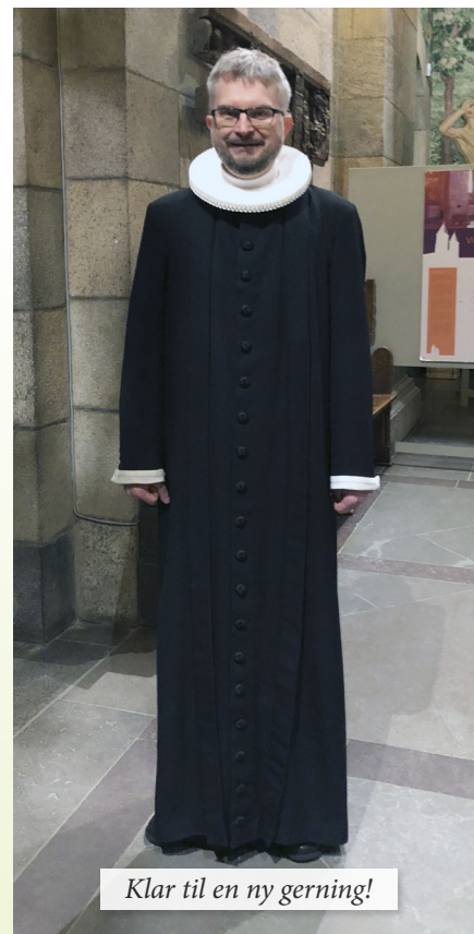
Klar til en ny gerning!

Men ved siden af mit studie- og arbejdsliv har jeg altid arbejdet med kirke og kristendom. Mine forældre har selv rødder i Indre Mission og KFUM og KFUK,