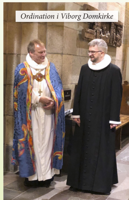
Ordination i Viborg Domkirke

og derfor var det naturligt for mig også at involvere mig i det kirkelige foreningsliv. Jeg har været med i KFUM og KFUK siden min barndom, og jeg har gennem tiden bl.a. både været leder i børneklubber og i konfirmand- og teenklubber. P.t. sidder jeg i KFUM og KFUK's hovedbestyrelse. Ud over KFUM og KFUK har