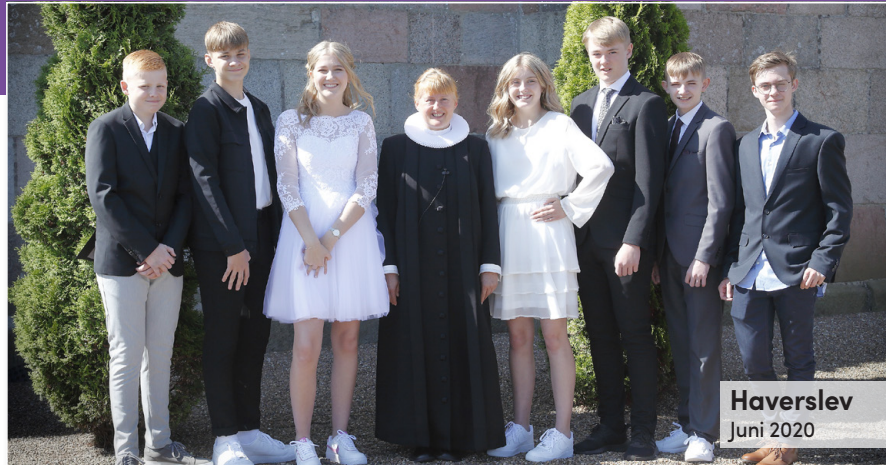
Haverslev Juni 2020