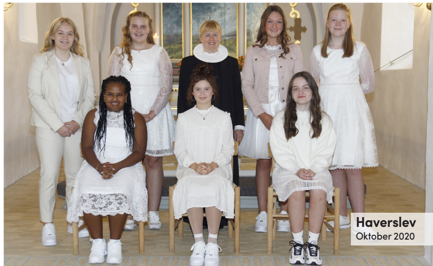
Haverslev Oktober 2020