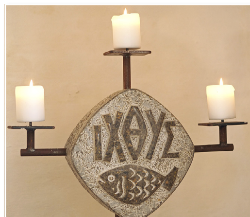
Lysestage fra Nr. Lyngby Kirke.