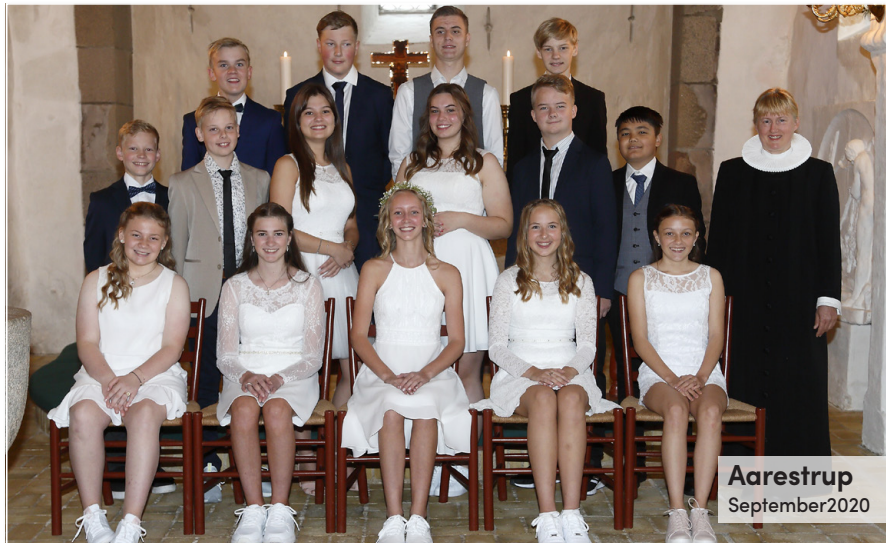
Aarestrup September 2020