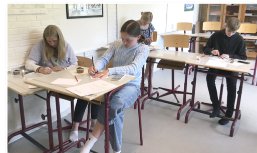
Konfirmanderne leder efter dagens salme i Salmebogen.

Undervisningen foregår onsdag morgen og eftermiddag og følger naturligvis de retningslinjer, der gælder både for kirkens lokaler og for skolen.