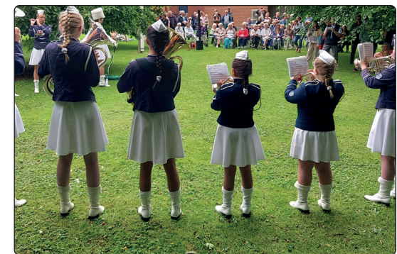
... Sankt Hans i præstegårdshaven.