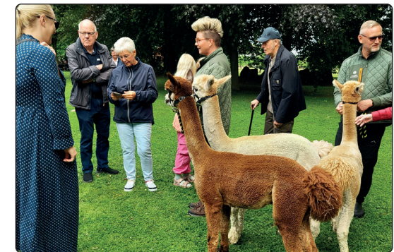
Alpac'er til Sankt Hans i præstegårdshaven.