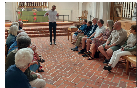
... sogneudflugt til Haderslev Domkirke.