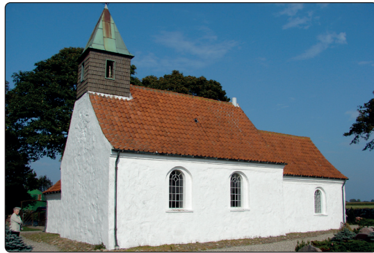
Valgforsamling tirsdag 17. september

I 2024 er der valg til menighedsrådene i hele landet. Et menighedsrådsvalg kan minde om et folketings- og/eller kommunal-valg, men det kan også minde om en almindelig generalforsamling sådan som mange kender det fra foreningslivet.