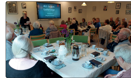
Sogne-eftermiddag i præstegården

Torsdag 21. november kl. 14.00 inviterer menighedsrådet til sogne-eftermiddag i Glud Præstegårds konfirmandlokaler. Desværre var det ikke muligt at få programmet aftalt inden kirkebladets deadline, så vi må bede om at man nu og her noterer sig datoen og så følger med på bl.a. Facebook og Brugsens lystavle, hvor vi vil annoncere arrangementet med flere detaljer, når vi nærmer os. Vi tør dog godt allerede nu slå fast at det bliver en sogneeftermiddag sådan som mange vil kende dem med besøg af en foredragsholder, samvær, sang og kaffe.