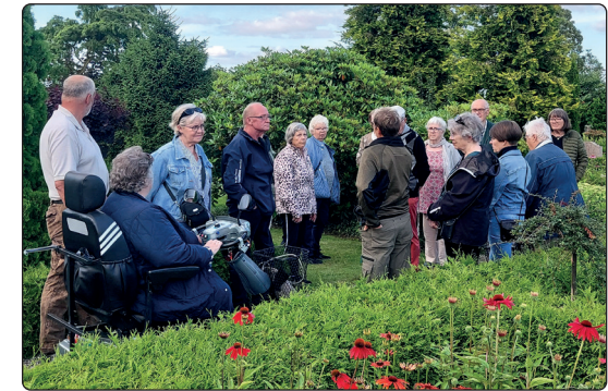
... kirkegårdsvandring 18. juli.