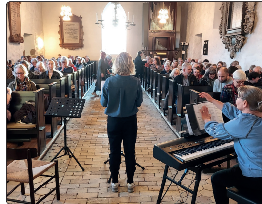
Forårets musikalske aften i Glud Kirke

Hvert år i uge 44 er der 'Spil dansk-uge' og Glud Kirke vil gerne koble sig på rækken af arrangementer landet over med en musikaften i Glud Kirke onsdag 30. oktober kl. 19.